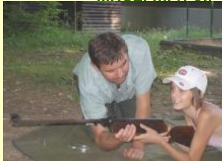
Pri streľbe zo vzduchovky treba byť opatrný