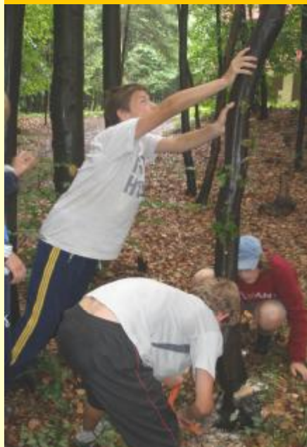
Piliť strom nie je ľahké, ak sa nechcete zranit'